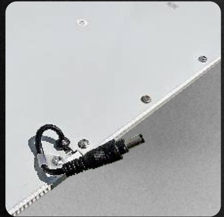
Voltaje desde 85 a 265V