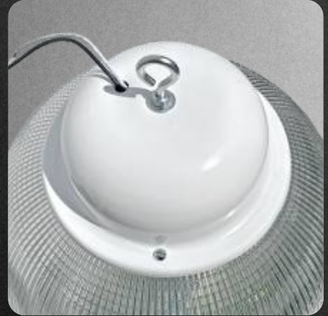
Difusor de acrílico