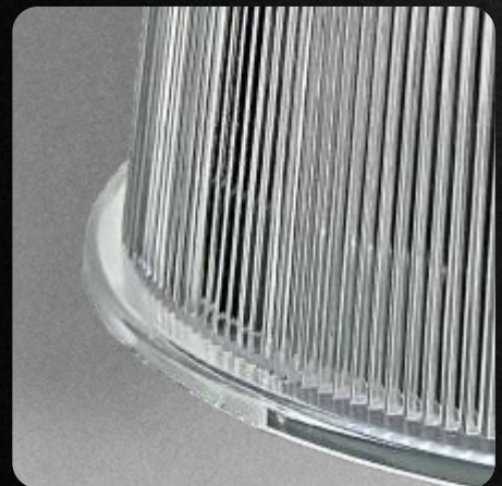
Garantía de 2 años