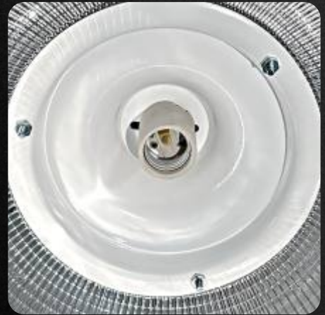
Soquet E39 / E26