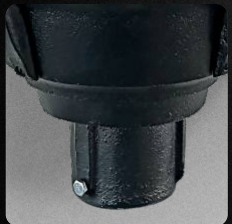
Garantía de 3 años