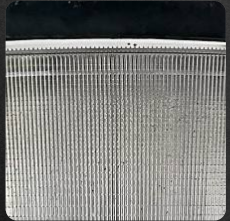
Difusor de acrílico policarbonato